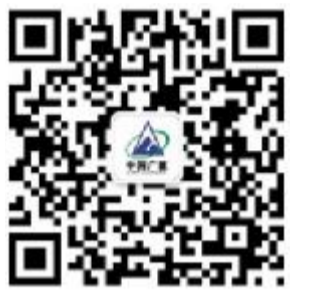
扫码参与投票活动

的投票通道。投票通道于6月21日正式开启，6月30日23时59分结束。大家可以扫描下方二维码，关注“广厦控股集团”微信公众号，回复“投票”即可参与投票活动。每个微信用户每日可投3票，为便于检索，大家可以通过搜索选手姓名的方式进行投票。本期报纸第2至第4版还推出专版，详细介绍31位候选人事迹。 (许向前)