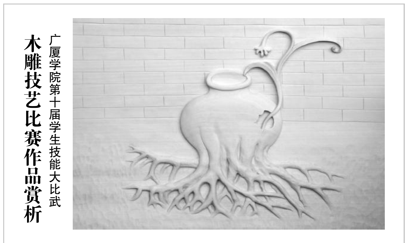
广厦学院第十届学生技能大赛比武 木雕技艺比赛作品赏析

国家有关部门对超低能耗被动式住宅的大力推广，得到各地政府的积极响应，被动房的发展被列入日程，相关政策甚至技术标准也纷纷制定。而一些企业也看到了被动房发展的良好前景，相继转向发展被动房。