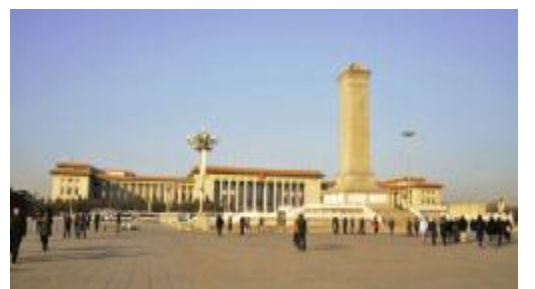
天安门人民英雄纪念碑