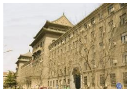
“四部一会”办公楼群