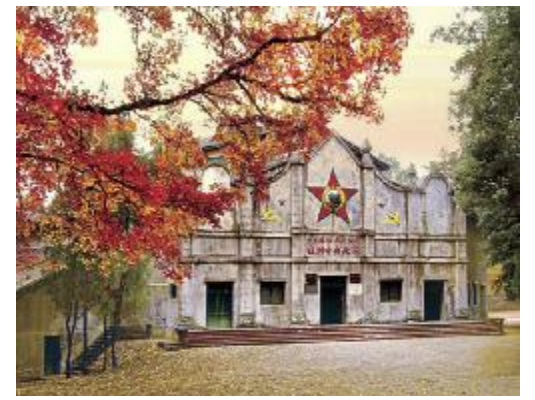
中华苏维埃共和国临时中央政府大礼堂

史时期社会、政治、经济、文化的发展。 在中国共产党成立 95 周年之际，本稿选取其中具有典型纪念性的几座建筑，回顾这些“红色建筑”背后的历史和“红色文化”。