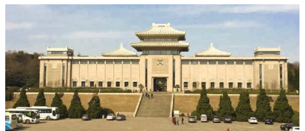
南京雨花台烈士纪念馆

新民主主义革命时期是我国现代建筑的发源期，也是我国“红色建筑”的萌芽期。其中最具有代表性的是 30 年代初建设的中华苏维埃共和国临时中央政府大礼堂、红军烈士纪念馆、红军检阅台、公略亭、博生堡、红军烈士纪念馆。