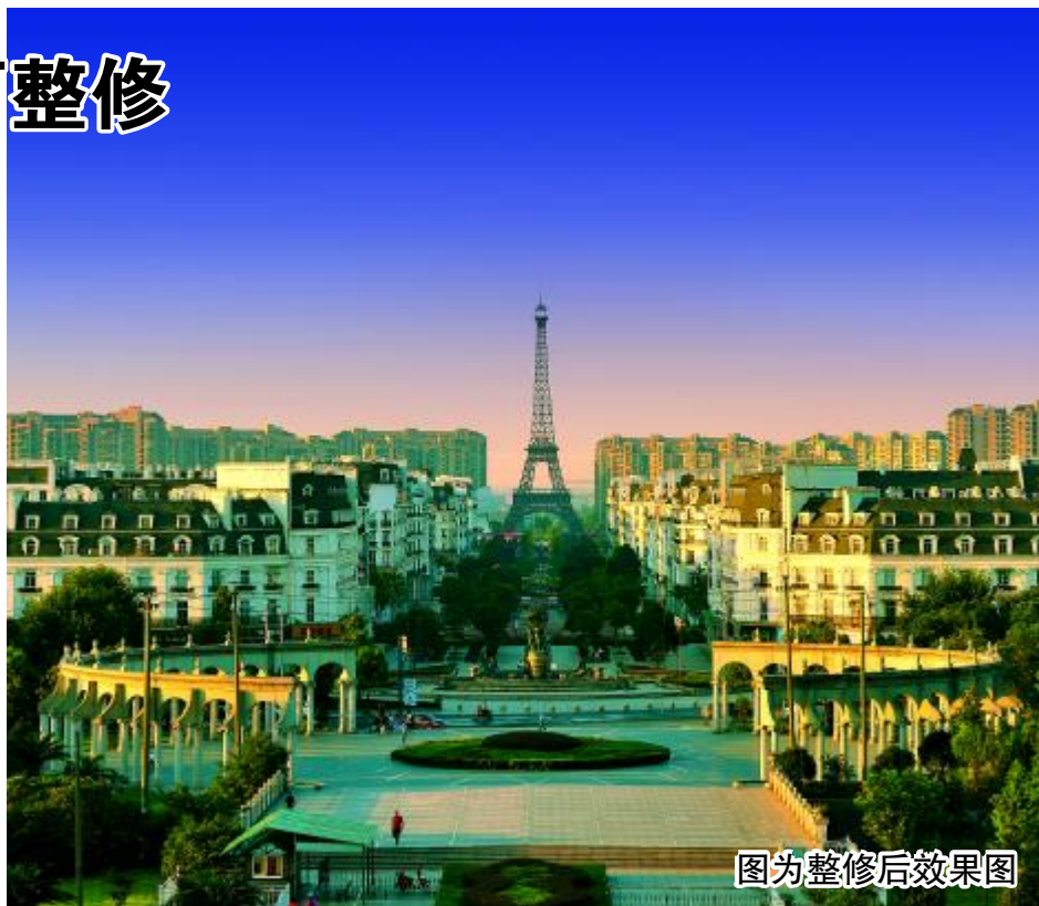
图为整修后效果图