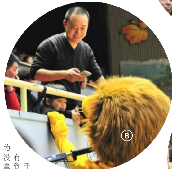
为没有拿到手环,失落得在围栏处和老爸撒娇。猛狮看见后,取下自己手上的手环送给小女孩,而且没有摘下笨重的毛绒头盔。这里有个冷知识要普及下,按照规定,吉祥物在球场等公众场合必须保持完整的吉祥物形象。这也是俱乐部职业化的一个微小细节吧。在这个气温骤降的冬天,小细节也是那样的温暖。

中场休息的时候,广厦男篮的吉祥物狮子向球迷们分发运动手环,调动现场气氛。互动环节结束后有一个小女孩因