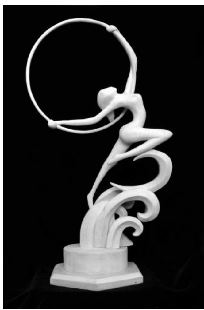
广厦学院第十届学生技能大比武 木雕技艺比赛作品赏析

第八条 本解释自发布之日起施行。此前发布的司法解释和规范性文件与本解释不一致的,以本解释为准。