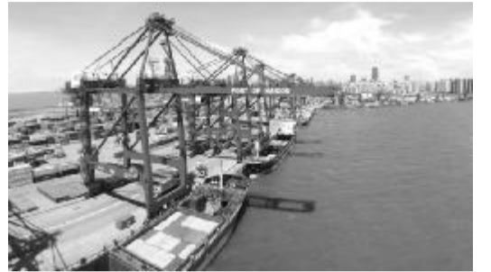
3月28日,国家发展改革委、外交部、商务部联合发布了《推动共建丝绸之路经济带和21世纪海上丝绸之路的愿景与行动》,本报将分期全文刊登。

在机会,在实体店里面面向的是本地区的某个区域,存在万人浏览同一店面的可能性有多大?再看全球其他有名的互联网公司 google、yahoo、Facebook、Youtube、百度、腾讯等公司他们的交易额和收益不是传统行业能够比拟的,为什么这些知名互联网公司能够做出巨大的成绩,是不是可以理解为他们所开发的产品都是从消费者的心理出发,如何方便消费者,面向全球70亿人的客户群,解决疑问 google、百度、邮件传递 yahoo、交友 Facebook、腾讯 QQ、视频 Youtube,都是为最大限度满足供需关系,小米公司可以在很短时间内脱颖而出,主要还是雷军的13人创业团队不断的向消费者征求消费者理想的手机是什么样的,小米家装以每月30个固定客户的形式进军家装行业,依靠的是什么,他不是做家装的,主要还是解决了消费者的心意,因为由于信息的不对称,家庭装修的消费者容易被当成猪来宰割。所以在移动互联网时代,消费者的主导权越来越强,发展下去就是消费者的商业社会,绝对不会再出现企业生产什么产品消费者就必须接受什么;而是消费者需求什么产品,企业再去生产何种产品,那么竞争的就是不同企业谁更能符合消费者的需求,谁就能够继续生存。