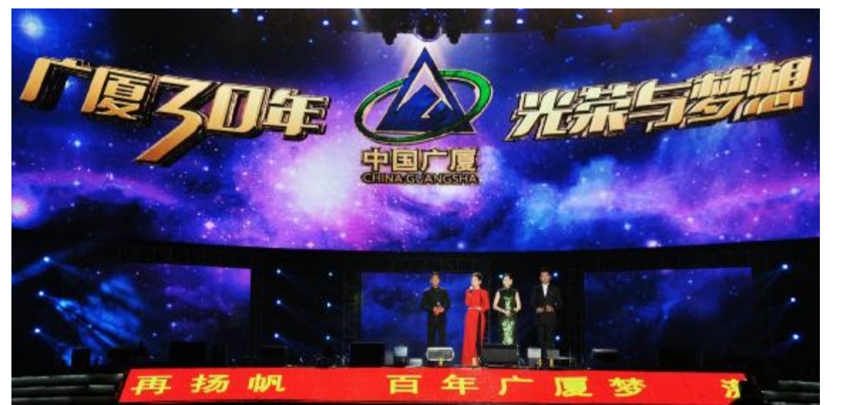
光荣与梦想文艺晚会