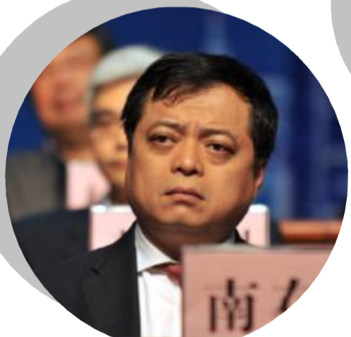
全国政协常委、浙江省工商联主席 正泰集团董事长南存辉