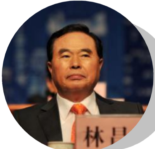
大韩民国前副总理林昌烈