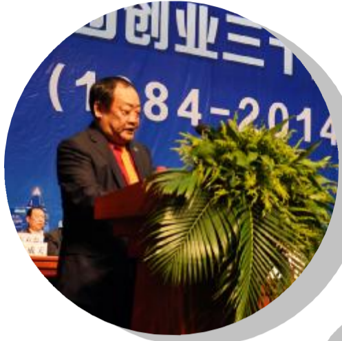
广厦控股董事局荣誉主席楼忠福