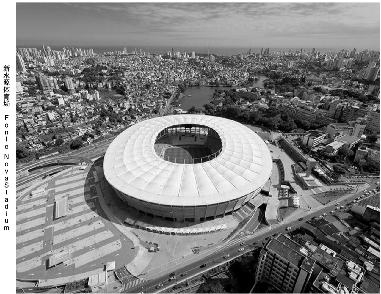
新水源体育场位于巴西萨尔瓦多,于1951年1月28日开放,三年后拆除。2010年新球场在旧址上修建,取代原有水源体育场。新水源体育场建筑高度35米,长250米,看台的南部有一个大型开口。这一开口不仅使体育场内空气流动,同时也使体育场与附近的内城湖泊有了直接的关系,为球场带来了新的空气流通。新水源体育场屋盖为索膜结构,屋盖悬挑63米,替代原来悬挑30米的屋盖。屋盖索膜结构失高最高19米。屋盖膜结构位于上下应力环之间。屋面采用由聚四氟乙烯纤维制造的PTFE膜材料,面积301399平方英尺。