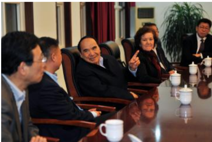
全国政协原副主席阿不来提·阿不都热西提与广厦领导座谈