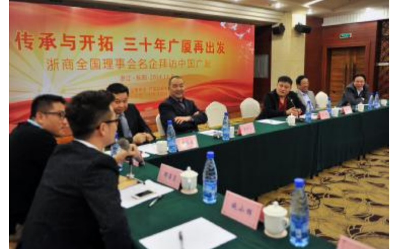
浙商全国理事会企业家恳谈会

本报讯 11月8日，广厦创业三十周年庆祝大会、文艺晚会在发祥地家乡东阳隆重举行。从1984到2014，历经30年风风雨雨，广厦由一名不见经传的乡镇企业，成长为名闻遐迩的商业帝国。而今，广厦更是吹响了奋力迈向世界500强的集结号。