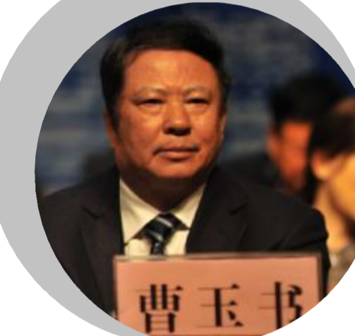
中国施工企业管理协会会长曹玉书