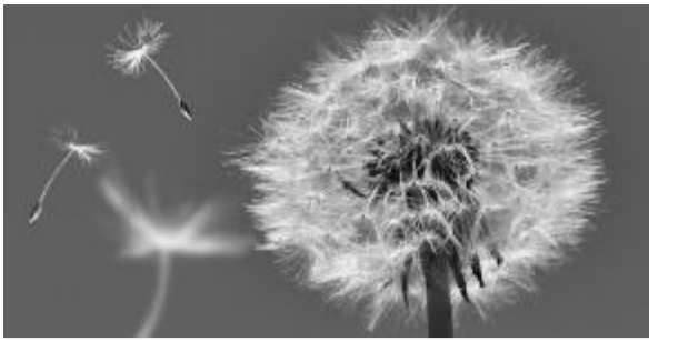
日本首相鸠山亲笔赞誉著作