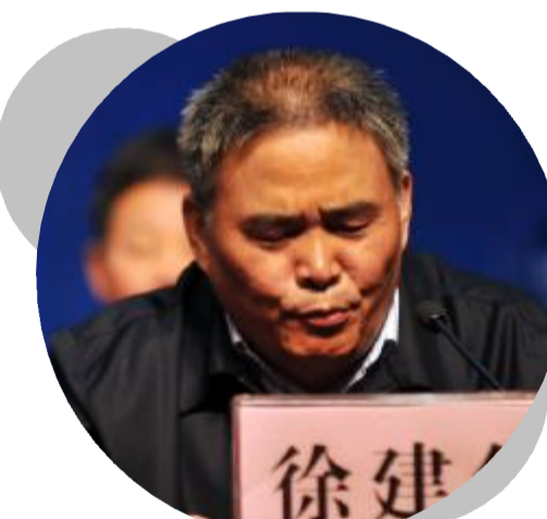
金华市委常委、东阳市委书记徐建华