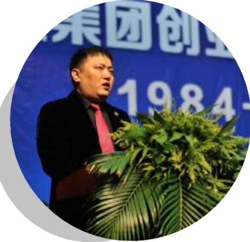
广厦控股董事局主席楼明