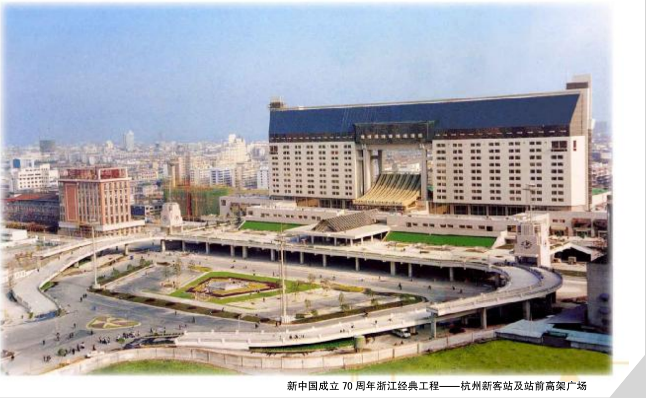
新中国成立70周年浙江经典工程——杭州新客站及站前高架广场