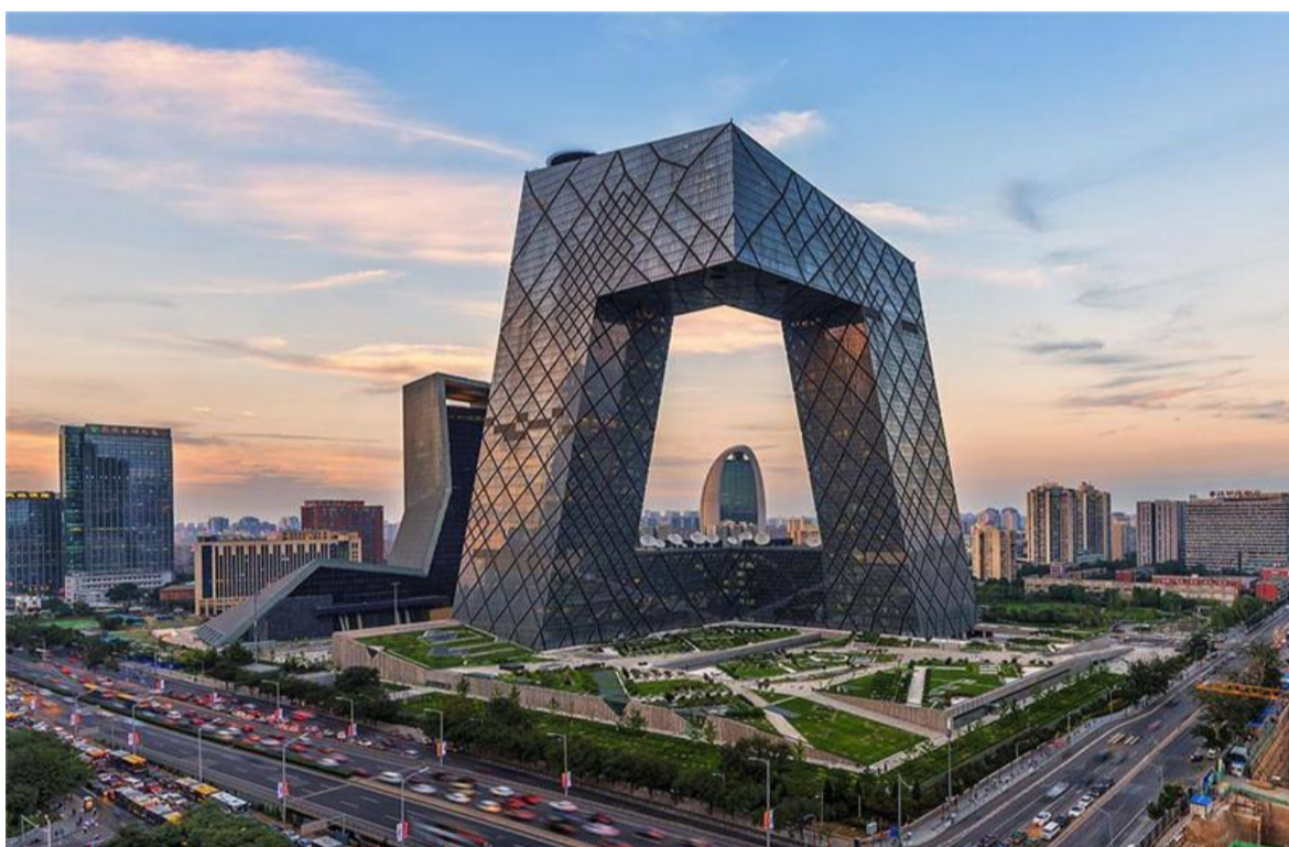
中央电视台总部大楼(CCTV Headquarters),位于北京市朝阳区东三环中路32号,地处北京商务中心区(CBD),比邻北京国贸大厦。园区共由三个建筑物组成:位于西南侧的中央电视台总部大楼(主楼)、位于西北侧的电视文化中心(北配楼)以及位于东北角的能源服务中心。中央电视台总部大楼占地面积18.7万平方米,总建筑面积约55万平方米,其中主楼为两栋分别为52层234米高和44层194米高的塔楼组成,设10层裙楼,并由在162米高空大跨度外伸,高14层重1.8万吨的钢结构大悬臂相交对接,总用钢量达14万吨。北配楼高159米,主楼为30层,裙楼为5层。于2004年10月21日动工建设,2012年5月16日全部竣工交付使用。中央电视台总部大楼于2007年12月24日被美国《时代》周刊杂志评选为2007年世界十大建筑奇迹之一;2013年11月7日获世界高层都市建筑学会(CTBUH)“2013年度全球最佳高层建筑奖”;2014年4月入围十大当代建筑之一。