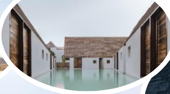
Punta Caliza 酒店, 墨西哥

一个占地 41000 平方米的垃圾发电厂，融合了城市娱乐中心和环境教育中心的功能。设施顶部的滑雪场、徒步旅行路线和攀岩墙，体现了享乐主义的可持续性概念。滑雪高手可滑下与奥运会 U 型滑道相同的人造滑雪坡，尝试自由滑或参与计时回转滑雪课程。