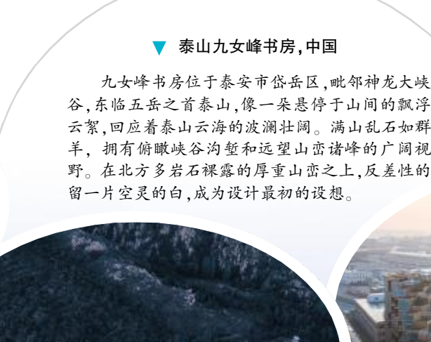
泰山九女峰书房, 中国

三个巨大的绿色屋顶覆盖在相互独立的房间之上，并以这种方式延续了墨西哥 Palapa (一种简陋的草棚) 建筑的简洁结构。“被解放”的墙体为被水环绕的景观提供了可能，用柏木建造的“草屋”散发着芳香的气息，酒店的中央只有潮湿而安静的水，酒店从场地中浮现，从特定的角度看，它的回廊犹如被淹没了一般。