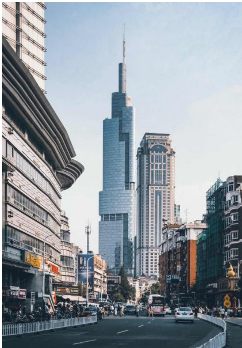
※中国当代优秀建筑