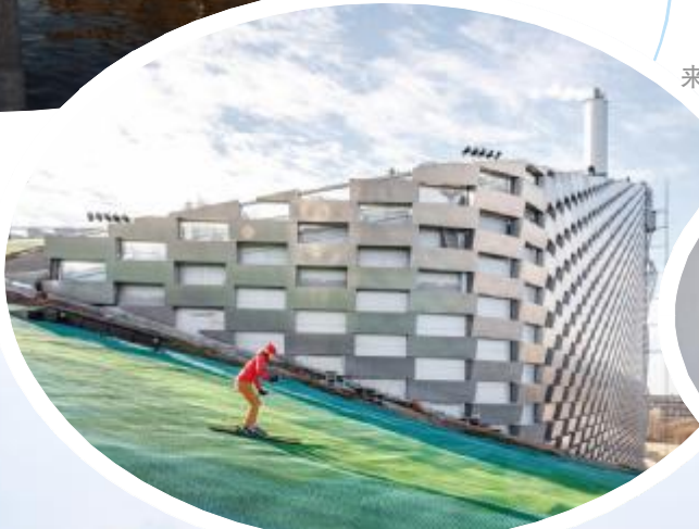
Copenhill 垃圾发电厂, 哥本哈根

一个占地 41000 平方米的垃圾发电厂，融合了城市娱乐中心和环境教育中心的功能。设施顶部的滑雪场、徒步旅行路线和攀岩墙，体现了享乐主义的可持续性概念。滑雪高手可滑下与奥运会 U 型滑道相同的人造滑雪坡，尝试自由滑或参与计时回转滑雪课程。